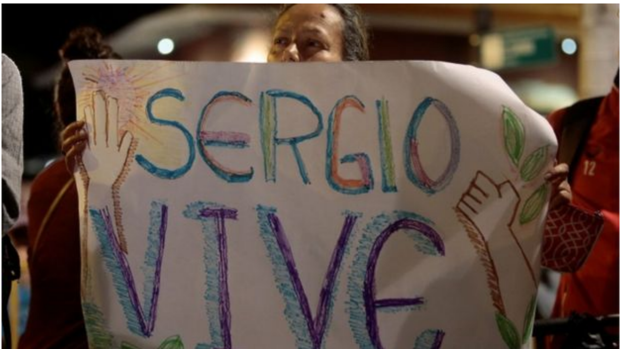
Foto extraída de nota de la BBC titulada “Asesinato de Sergio Rojas: la conmoción en Costa Rica por la muerte del líder indígena que defendía las tierras de pueblos originarios”, edición

El hecho que Sergio Rojas fuera objeto de medidas cautelares ordenadas en el 2015 al Estado costarricense por la Comisión Interamericana de Derechos Humanos para resguardar su vida y su integridad física evidencia el alcance de la inoperancia estatal antes referida, que detallaremos en el marco de estas breves reflexiones.