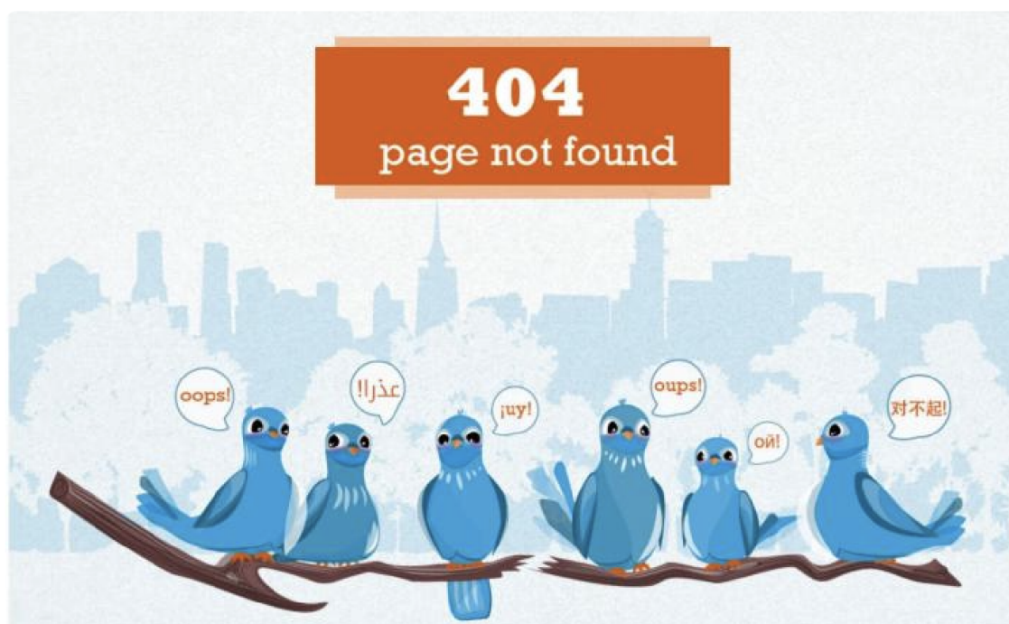
UN error page

Titled “The Benefits of World Hunger,” the post sparked outrage among Twitter users on Wednesday. Following criticism of the article, the link now leads to an error page.