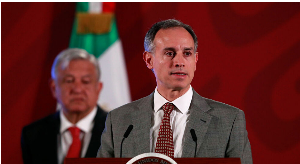
Hugo López-Gatell, subsecretario de Salud del gobierno de México

De ahí que otro de los escenarios que es posible postular de cara a la crisis epidemiológica, consiste en una radicalización del aislacionismo, el nativismo, y el nacionalismo; y aunque el Estado tendrá mayores potestades en el proceso económico, ello no supondrá que el fundamentalismo de mercado se repliegue, pero sí que el endeudamiento público –contraído con la banca privada– sea el eje rector del “rescate del capitalismo”.