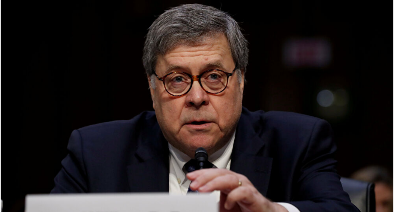
El Fiscal General de Estados Unidos, William Barr

Con un conjunto conmovedor, extrapolando desde el mínimo de datos, la dócil corporación de formadores de opinión -comenzando con The Wall Street Journal (Estados Unidos) y El Mundo (España) [13]- se encarga de difundir la acusación. Dejemos que los más cautelosos de sus colegas asuman palabras a medias, con golpes de hipócrita “condicional”, que es suficiente para impresionar una “verdad” en la opinión. Más directamente, el senador republicano cubanoamericano, Marco Rubio, convirtió a Cabello en “el venezolano Pablo Escobar”.