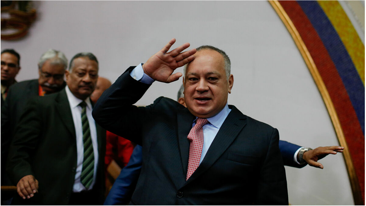
Diosdado Cabello, presidente de la Asamblea Nacional Constituyente

Esta ofensiva del régimen de Donald Trump contra el gobierno bolivariano ha multiplicado por 10 los excesos, pasiones y apetitos prohibidos de la derecha extremista venezolana (y sus aliados). Comenzando con la góndola principal, el “presidente” (elegido por Trump), Juan Guaidó. “Estoy convencido de que las acusaciones hechas contra miembros del régimen son sólidas y ayudarán a liberar al país del sistema criminal que secuestró a nuestro pueblo durante tantos años”, reaccionó inmediatamente a través de un comunicado. Como lo hizo durante décadas al anunciar la “inminente caída de Fidel Castro”, el cubanoamericano (y español) Carlos Alberto Montaner ya prevé “el fin del chavismo” desde la prensa de Miami: “Después de la acusación hecha contra Maduro y sus acólitos por el Departamento de Estado y el de Justicia, las predicciones cambian completamente, hasta que alguien de su entorno decide eliminarlos” [4].