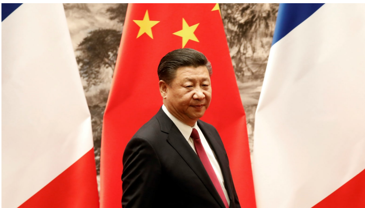
Xi Jinping, presidente de la República Popular China

Con esa sesgada mirada se cuestiona el sistema político chino desconociendo lo ocurrido en la contraparte. Suelen olvidar la inexistencia de democracia genuina en las plutocracias de Occidente. Esa ceguera ante la propia realidad impide percibir la variedad de tendencias y opiniones que se verifican en otros regímenes políticos.