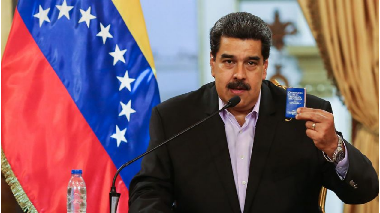
El presidente de Venezuela, Nicolás Maduro

Tenemos lo mismo en el Consejo de Seguridad de la ONU, tenemos divididos entre Rusia, China y otros países importantes que están bloqueando cualquier esfuerzo de disfrazar un golpe con la cobertura de Naciones Unidas.