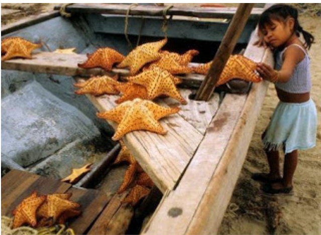
Colombia: 14 mil niños Wayúu ya han muerto de enfermedades asociadas a la falta de agua: a causa de la privatización de un río por las multinacionales.

Un puñado de multimillonarios posee los principales medios de producción y medios de propaganda y difusión. El 1% de la población mundial posee el 82% de la riqueza mundial. La base de datos de consumo de energía eléctrica per cápita, evidencia que son Europa, Estados Unidos, Canadá y demás metrópolis capitalistas, las que consumen, y de lejos, la inmensa mayoría de la energía consumida a nivel mundial. En el discurso de la Máscara Verde, se equipara la depredación que cometen los grandes capitalistas, las gigantescas empresas que secuestran ríos enteros para la mega minería, con los pueblos que son sus víctimas.