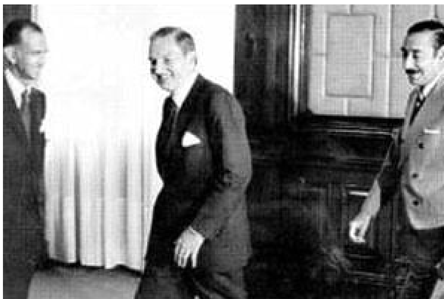
Imagen: Presidente General Jorge Videla, David Rockefeller y Ministro de Economía de Argentina Martínez de Hoz, Buenos Aires (década de 1970)

Dos años y medio después, en 1976, regresé a América Latina como profesor invitado en la Universidad Nacional de Córdoba en el corazón industrial del norte de Argentina. Mi estadía coincidió con otro golpe de estado militar en marzo de 1976. Detrás de las masacres y las violaciones de los derechos humanos, también se habían prescrito reformas macroeconómicas de “libre mercado” , esta vez bajo la supervisión de los acreedores de Argentina en Nueva York, incluido David Rockefeller , quien era amigo del Ministro de Economía de la Junta, José Alfredo Martínez de Hoz.