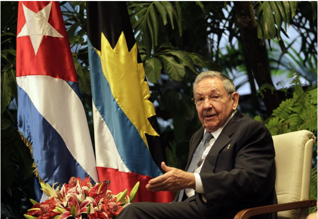
Presidente de Cuba, Raúl Castro recibió jefes de gobierno y de Estado en la isla

En un largo editorial, el New York Times exhortó a Washington a que cambiara de política y estableciera una relación más apaciguada con La Habana: