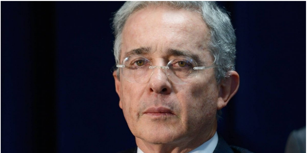
El expresidente de Colombia, Álvaro Uribe

“La señora López me acusa de fundador del paramilitarismo, de utilizar paramilitares para asesinar a mis opositores, y para convalidar su infamia obliga a gastar 300 mil millones de los recursos públicos (...)El doctor Petro me acusa de delitos de lesa humanidad, clama para que me lleven a la cárcel y para eso hace gastar 300 mil millones”, añadió.