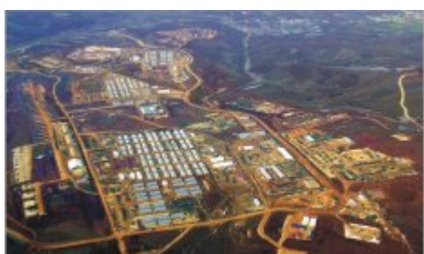
Camp Bondsteel, 15 October 1999

(Véase Paul Stuart, “Camp Bondsteel and America’s plans to control Caspian oil”, WSWS.org, abril de 2002, http://www.wsws.org/articles/2002/apr2002/oil-a29.shtml )