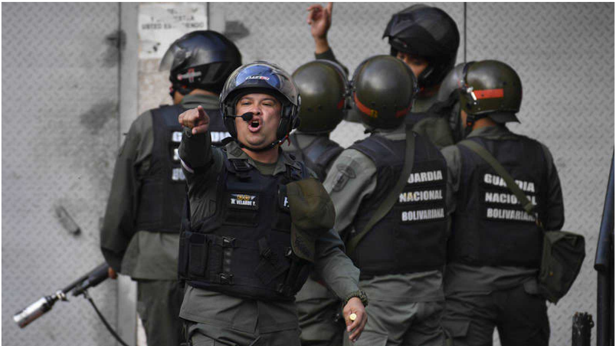
Elementos de la Guardia Nacional Bolivariana

Otra fortaleza del chavismo se encuentra en la articulación geopolítica que se ha construido en vista de un continente en su mayoría en mano de derechas revanchistas subordinadas a los EE.UU., y de un conflicto entre grandes potencias. El gobierno ha fortalecido vínculos con Rusia y China en particular, enmarcando a su vez la pelea por Venezuela en la gran pelea internacional. Eso ha significado apoyos diplomáticos, económicos y militares.