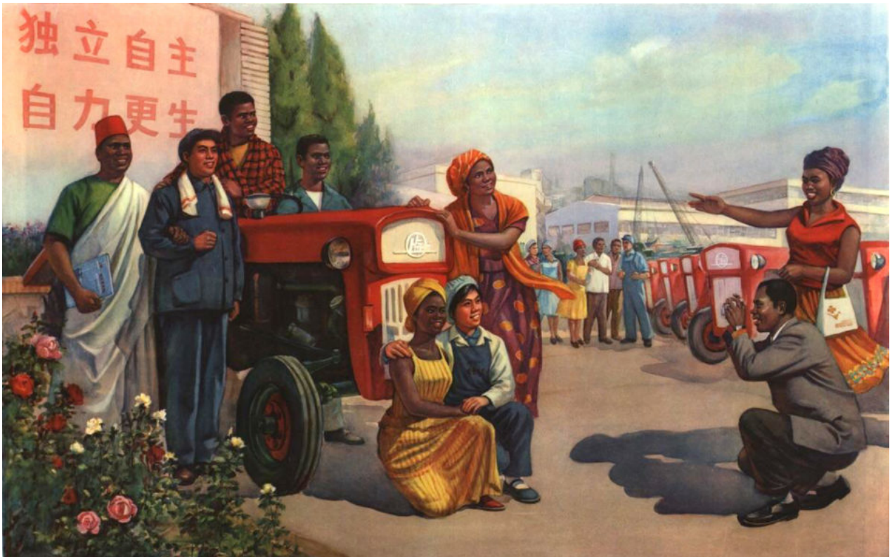
Guo Hongwu (China), 革命友谊深如海 [La amistad revolucionaria es tan profunda como el océano], 1975.

Los gobiernos respaldados por Occidente que siguieron a estos golpes a menudo revirtieron las políticas para ejercer la soberanía nacional y construir la unidad continental. Por ejemplo, en 1966, los líderes militares del Consejo de Liberación Nacional de Ghana empezaron a dismantelar la política de establecer una educación pública de calidad y un sector público eficiente con la industrialización y el comercio continental en el centro. Las políticas de sustitución de importaciones que habían sido importantes para los nuevos Estados del Tercer Mundo fueron rechazadas en favor de la exportación de materias primas a bajo precio y la importación de productos acabados caros. La espiral de deuda y dependencia sacudió el continente. Esta situación empeoró con los Programas de Ajuste Estructural del Fondo Monetario Internacional (FMI), puestos en marcha durante lo peor de la crisis de la deuda de los años ochenta. Un artículo de investigación de 2009 del South Centre señalaba que “el continente es la región menos industrializada del mundo, mientras que la cuota del África subsahariana en el valor añadido manufacturero mundial disminuyó de hecho en la mayoría de los sectores entre 1990 y 2000”. Efectivamente, el documento del South Centre se refería a la situación de África como de “desindustrialización”.